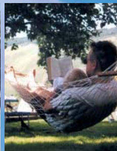
Freizeitspaß bei Sport und Spiel