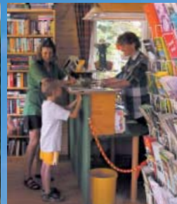
Wir nehmen uns Zeit für Ihre Wünsche

Von Weinbergen umsäumt, bietet unser Campingplatz einen weiten Blick auf die sanften Windungen des Moseltals. In unmittelbarer Nähe lockt das mittelalterliche Städtchen Bernkastel-Kues mit seinem Fachwerkcharme. Entspannen Sie sich unter freiem Himmel oder nutzen Sie die reichhaltige Erlebnispalette unserer einmaligen Umgebung. Als Ihre Gastgeber freuen wir uns darauf, Sie zu verwöhnen und Ihre Ferien zu einem unvergesslichen Erlebnis werden zu lassen. Willkommen in Deutschlands ältester Kulturlandschaft!