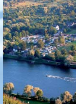
Ihr Platz auf der Sonnenseite

Het maakt niet uit of u met caravan, camper of tent reist: Bij ons vindt u uw lievelingsplaats, die geheel naar uw wensen is aangepast. Alle standplaatsen zijn goed onderhouden en comfortabel, stroom- en wateraansluiting vindt u direct op of in de onmiddellijke nabijheid van uw plaats. Door de terrasvormige aanleg van onze camping heeft u een indrukwekkend uitzicht op zonnige wijnen, beboste bergtoppen en voor een deel op de voorbijstromende Moesel. De hoge ligging garandeert, dat u geen natte voeten krijgt.