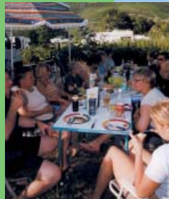
Entspannung mitten in der Natur und gesellige Gaumenfreuden

Switch off from the daily troubles, read a good book, cycle through dreamy villages and sunny vineyards. Here you will find the relaxation which brings body and soul back together again. To start the day well we have fragrant, fresh rolls available from reception and we can also offer you local wines either from reception or, in the evening, in our wine stube. In this carefree atmosphere you will quickly make new friends.