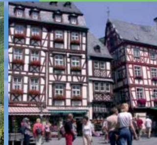
Bummeln durch mittelalterliche Fachwerk-gässchen